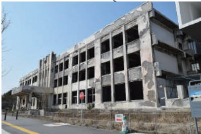
震災遺構 門脇小学校

五月二十三日。石巻市震災遺構門脇小学校を視察した。この小学校は東日本大震災による津波火災の痕跡を唯一残した施設であるとともに、迫り来る火災の中で校内の避難者が日和山へ避難することができた経験を有している施設です。被災した学校に残された防火扉や下駄箱、黒板などを展示、震災被害の映像上映、体験者の記憶と言葉で表現した空間などがあり、津波火災の恐ろしさを実感した。