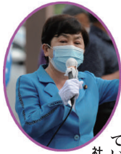
社民党党首 福島 瑞穂