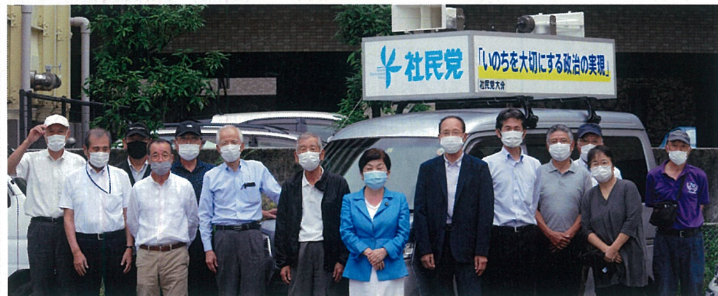
福島瑞穂党首と大分県連合・支部常任幹事のみなさんと小型強力街宣車